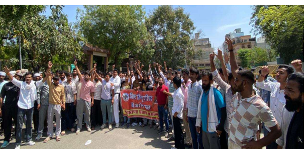
भीलवाड़ा फोकस @ भीलवाड़ा