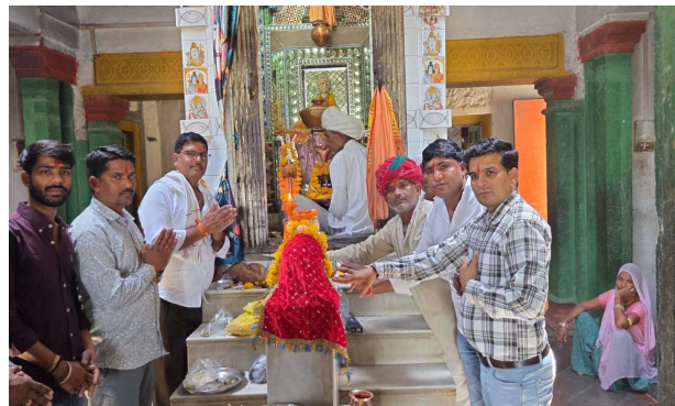
समृद्धि की कामना की गई। 'हर-हर महादेव' और 'पंचमुखी महादेव शुभ मुहूर्त में मंदिर के शिखर पर नई ध्वजा फहराई गई। इस दौरान पूरा परिसर श्रद्धालुओं में विशेष उत्साह देखने को

वैशाखी पूर्णिमा के पावन अवसर पर अखिल मेवाड़ राज माली समाज ट्रस्ट, मातृकुंडिया (रज.) के तत्वावधान में प्रभु श्री पंचमुखी महादेव मंदिर पर भव्य ध्वजा रोहण कार्यक्रम आयोजित किया गया। मेवाड़ के हरिद्वार कहे जाने वाले मातृकुंडिया में स्थित राज माली समाज की सराय परिसर में बने इस मंदिर में बड़ी संख्या में समाजजन शामिल हुए। कार्यक्रम की शुरुआत विधि-विधान के साथ पूजा-अर्चना एवं महादेव के अभिषेक से हुई। इसके पश्चात शांति हवन यज्ञ का आयोजन किया गया, जिसमें आहुतियां देकर क्षेत्र की सुख-