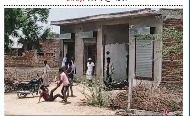
भीलवाड़ा फोकस @ सांवर