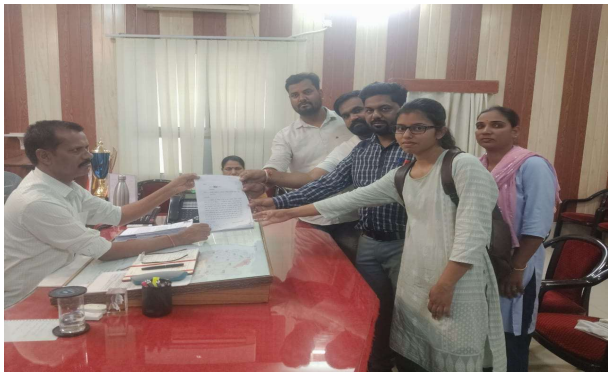
भीलवाड़ा फोकस @ भीलवाड़ा ।

कर्मचारी महासंघ ने उठाई आवाज, मांगें नहीं मानी तो भूख हड़ताल की चेतावनी