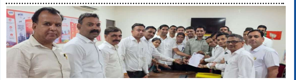
भीलवाड़ा फोकस @ भीलवाड़ा ।