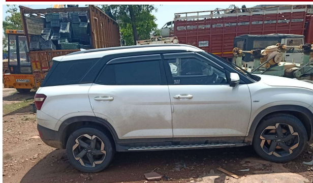
भीलवाड़ा फोकस @ बिजौलिया।