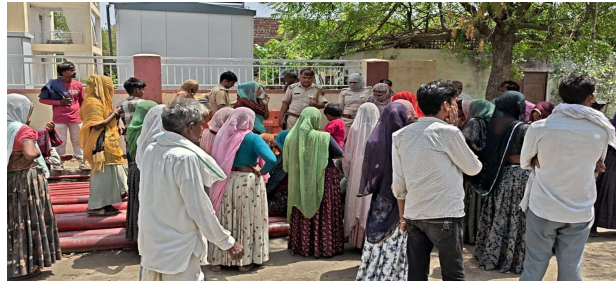
भीलवाड़ा फोकस @ भीलवाड़ा।