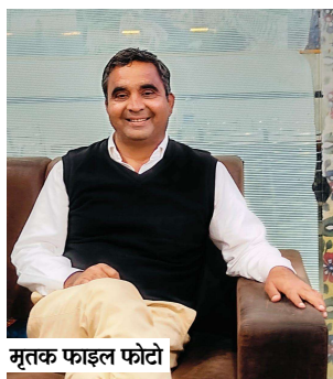
मृतक फाइल फोटो

किया जा रहा था। यहां तक कि परिवार के बच्चों और अन्य सदस्यों को भी धमकी भरे कॉल किए जाते थे। उन्होंने बताया कि मृतक ने वीडियो में स्पष्ट कहा है कि मूल रकम से कई गुना अधिक भुगतान करने के बावजूद बार-बार पैसे मांगे जा रहे थे। उन्होंने प्रशासन से आरोपियों के खिलाफ सख्त कार्रवाई कर परिवार को न्याय