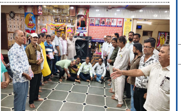
भीलवाड़ा फोकस @ भीलवाड़ा ।