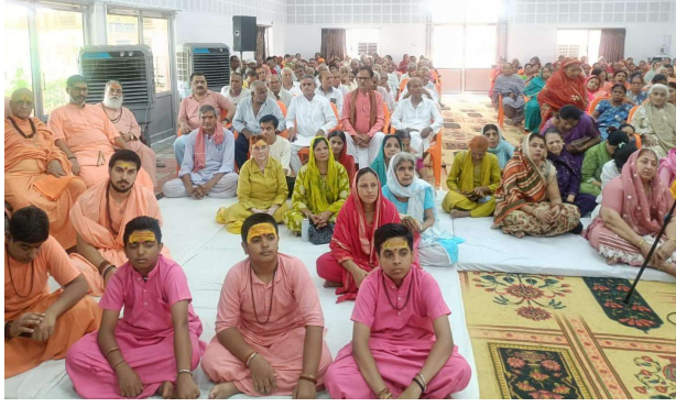
भीलवाड़ा फोकस @भीलवाड़ा ।