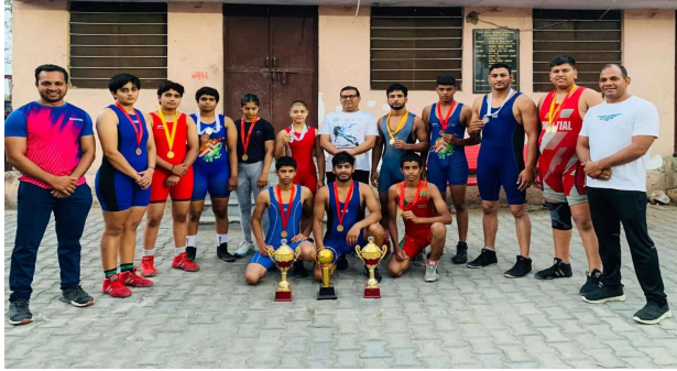
उपलब्धि अब तक किसी अन्य जिले के नाम नहीं रही। प्रतियोगिता में