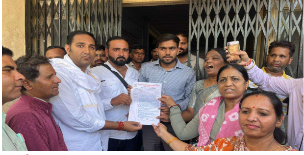
भीलवाड़ा फोकस @ शाहपुरा।

नौकरशाही के खिलाफ सड़कों पर उतरा शिक्षक वर्ग, चेतावनीक अब आर-पार की लड़ाई होगी