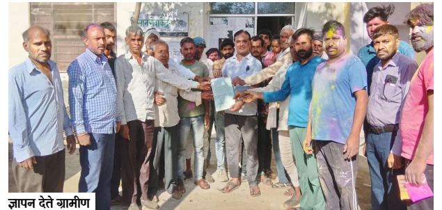
ज्ञापन देते ग्रामीण

था। बुजुर्गों का कहना है कि यह पेड़ लगभग 125 वर्ष पुराना था और गांव की पहचान बन चुका था। आरोप है कि कुछ प्रभावशाली लोगों ने अपने निजी स्वार्थ के चलते इस ऐतिहासिक स्थल को नुकसान पहुंचाया। पहले चबूतरे को तोड़ दिया गया और फिर हे-भरे बरगद के पेड़ को पूरी तरह