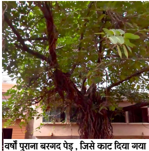
वर्षों पुराना बरगद पेड़, जिसे काट दिया गया