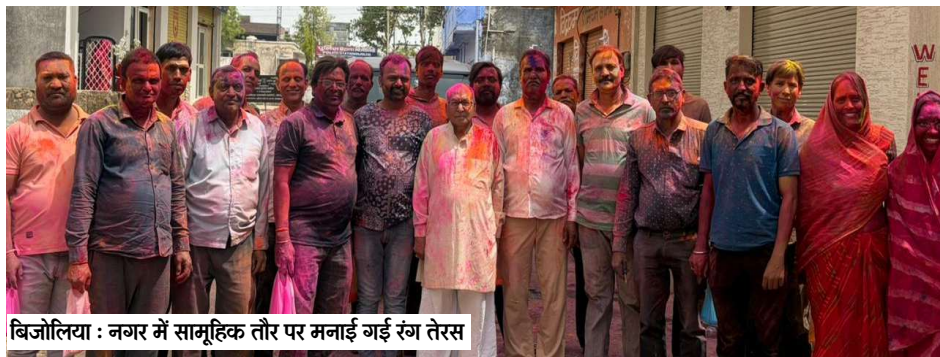
बिजोलिया : नगर में सामूहिक तौर पर मनाई गई रंग तेरस

सुबह से ही गली-मोहल्लों में डीजे की धुनों पर युवा और बच्चे थिरकते नजर आए। रंग-बिरंगे गुलाल और पानी की फुहारों के बीच पूरे दिन उत्सव जैसा माहौल बना रहा। खासकर बच्चों और युवाओं में होली को लेकर जबरदस्त उत्साह देखने को मिला, जिन्होंने टोली बनाकर पूरे कस्बे में रंग खेला। इस दौरान उपखंड क्षेत्र में कई जगह