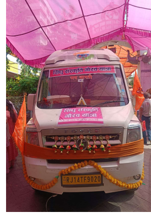
कार्यक्रम में भगवान झूलाल के चित्र