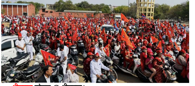
भीलवाड़ा फोकस @ भीलवाड़ा।

चेटीचंड महोत्सव से पूर्व शहर हुआ भक्तिमय, जगह-जगह पुष्पवर्षा व स्वागत