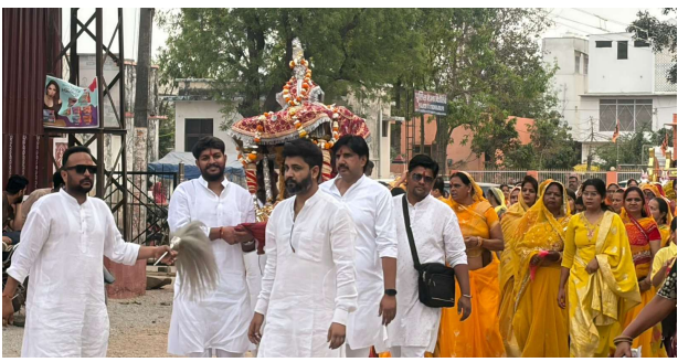
भीलवाड़ा फोकस @ बिजौलिया।

यज्ञ-हवन, शोभायात्रा और प्रतिभा सम्मान के साथ आयोजित हुए कार्यक्रम