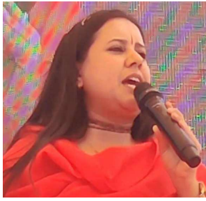
भीलवाड़ा फोकस @ शाहपुरा

'रामस्नेही नगर' नाम रखने की अपील, धर्मसभा में गूँजे शास्त्र-शास्त्र के स्वर