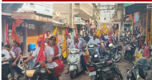
भीलवाड़ा फोकस @ शाहपुरा।

वाहन रैली, भजन संध्या और प्रसाद वितरण से बना भक्तिमय माहौल