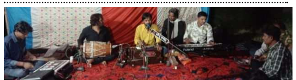
भीलवाड़ा फोकस @ जहाजपुर।