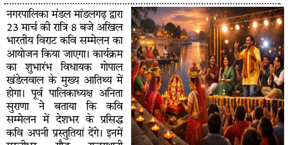
भीलवाड़ा फोकस @ मांडलगढ़।