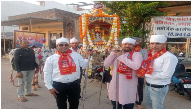
भीलवाड़ा फोकस @ मांडलगढ़।

भव्य वाहन रैली का जगह-जगह स्वागत, 'झूलेलाल बेड़ा पार' के जयकारों से गूंजा शहर