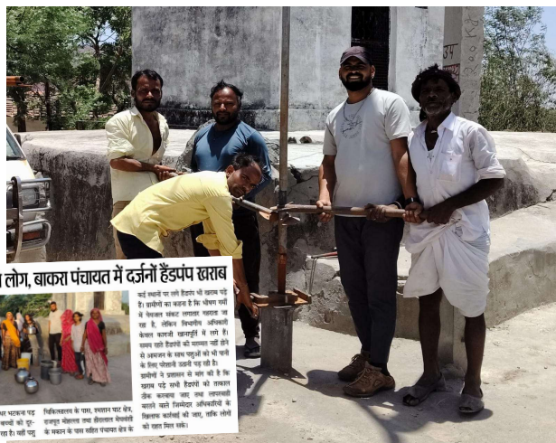
भीषण गर्मी में बूंद-बूंद को तरसे लोग, बाकरा पंचायत में दर्जनों हैंडपंप खराब

भीषण गर्मी के बीच ग्राम पंचायत बाकरा में खराब पड़े हैंडपंपों को लेकर प्रकाशित खबर का असर देखने को मिला है। 'भीलवाड़ा फोकस' में 'भीषण गर्मी में बूंद-बूंद को तरसे लोग, बाकरा पंचायत में दर्जनों हैंडपंप खराब' शीर्षक से खबर प्रकाशित होने के बाद जन स्वास्थ्य अभियांत्रिकी विभाग (PHED) सक्रिय हुआ और विभागीय टीम ने मौके पर पहुंचकर खराब पड़े हैंडपंपों की मरम्मत कर उन्हें पुनः चालू कर दिया। इसके बाद ग्रामीणों ने राहत