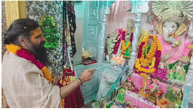
भीलवाड़ा फोकस @ भीलवाड़ा ।

गौ सम्मान आवाहन अभियान से जुड़े - कोठारी