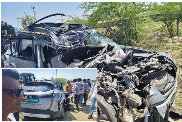
सड़क सुरक्षा को लेकर प्रशासन एक्शन मोड में

टक्कर के बाद बस अनियंत्रित होकर सड़क किनारे पलट गई। बस में सवार यात्रियों में चीख-पुकार मच गई। आसपास के लोगों ने तुरंत राहत कार्य शुरू कर घायलों को बाहर निकाला और पुलिस को सूचना दी।