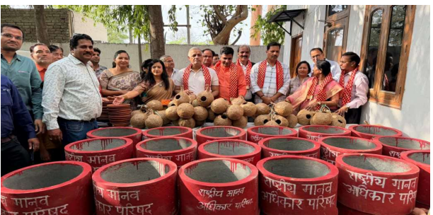
भीलवाड़ा फोकस @ भीलवाड़ा।

भीषण गर्मी में पशु-पक्षियों की प्यास बुझाने के लिए राष्ट्रीय मानव अधिकार परिषद द्वारा 'जीव दया अभियान' के तहत कोठारी निवास अजमेर रोड पर सेवा कार्यक्रम आयोजित हुआ। इसमें 100 पानी की टंकियां, गौ-पात्र, परिडे व पक्षी घर निःशुल्क वितरित किए गए।