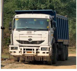
भीलवाड़ा फोकस @ सवाईपुर