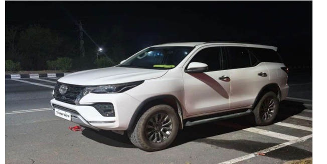
भीलवाड़ा फोकस @ भीलवाड़ा