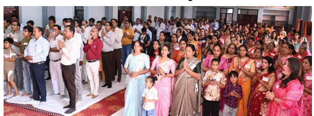
भीलवाड़ा फोकस @ भीलवाड़ा।

श्री वर्धमान स्थानकवासी जैन श्रावक समिति न्यू आजाद नगर श्री संघ के तत्वावधान में सिखवाल भवन में स्नेह मिलन कार्यक्रम आयोजित हुआ, जिसमें बड़ी संख्या में समाजजन शामिल हुए। कार्यक्रम की शुरुआत नवकार महामंत्र के साथ हुई। इसके बाद पुरुष, महिला व बच्चों के लिए खेलकूद प्रतियोगिताएं तथा सांस्कृतिक प्रस्तुतियां आयोजित की गईं,