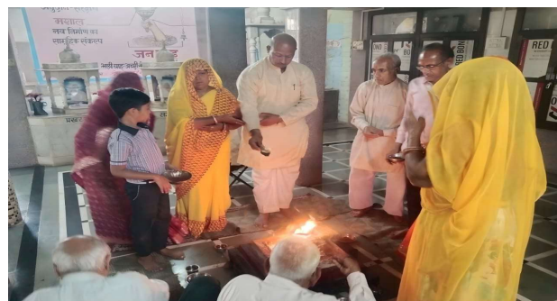
भीलवाड़ा फोकस @ काछेला।

कस्बे के बस स्टैंड स्थित गायत्री शक्तिपीठ मंदिर में नवरात्र पर्व को लेकर श्रद्धा और भक्ति का माहौल देखने को मिला। विधि-विधान और मंत्रोच्चार के साथ भक्तों ने विशेष पूजा-अर्चना की। बड़ी संख्या में श्रद्धालु मंदिर पहुंचे और