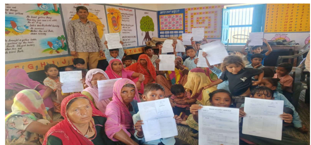
भीलवाड़ा फोकस @ आसीद।

सीबीईओ परिक्षेत्र के 219 राजकीय विद्यालयों में मेगा पीटीएम का आयोजन किया गया। कार्यक्रम में बड़ी संख्या में अभिभावकों ने भाग लेकर बच्चों की शैक्षणिक प्रगति की जानकारी ली। इस दौरान कक्षा 1 से 4, 6 से 9 व 11 के वार्षिक परीक्षा परिणाम घोषित किए गए