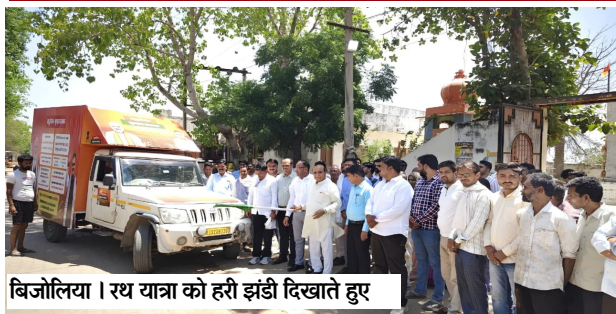
बिजौलिया। रथ यात्रा को हरी झंडी दिखाते हुए

ढाणी-ढाणी तक पहुँचेंगी योजनाओं की जानकारी, मौके पर ही गाड़ोलिया लोहार समाज की समस्या का समाधान