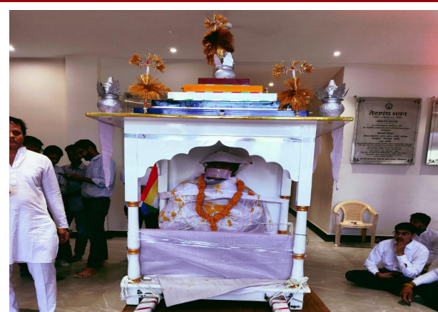
महाश्रमण का विशेष सानिध्य एवं आशीर्वाद